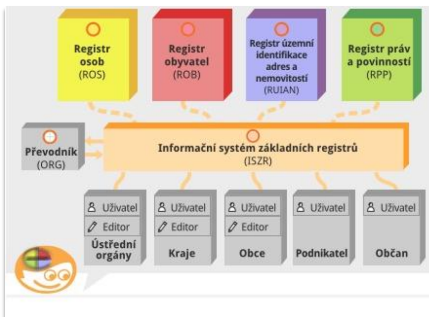
Schéma fungování celého systému základních registrů

S účinností k 1.1.2010 vznikl nový správní úřad, zaměstnavatel a daňový subjekt Správa základních registrů. Proto mezi základní provozní úkoly patřilo v roce 2010 zajištění všech povinností, které s touto skutečností souvisejí, tzn. zajištění sídla úřadu, přidělení IČO, přihlášení u příslušného finančního úřadu, správy sociálního zabezpečení, zdravotních pojišťoven, zřízení účtů u České národní banky atp. Dále byla zřízena úřadu datová schránka, dálkově přístupná elektronická podatelna a vlastní webová prezentace se všemi náležitostmi, které ukládají zákony.